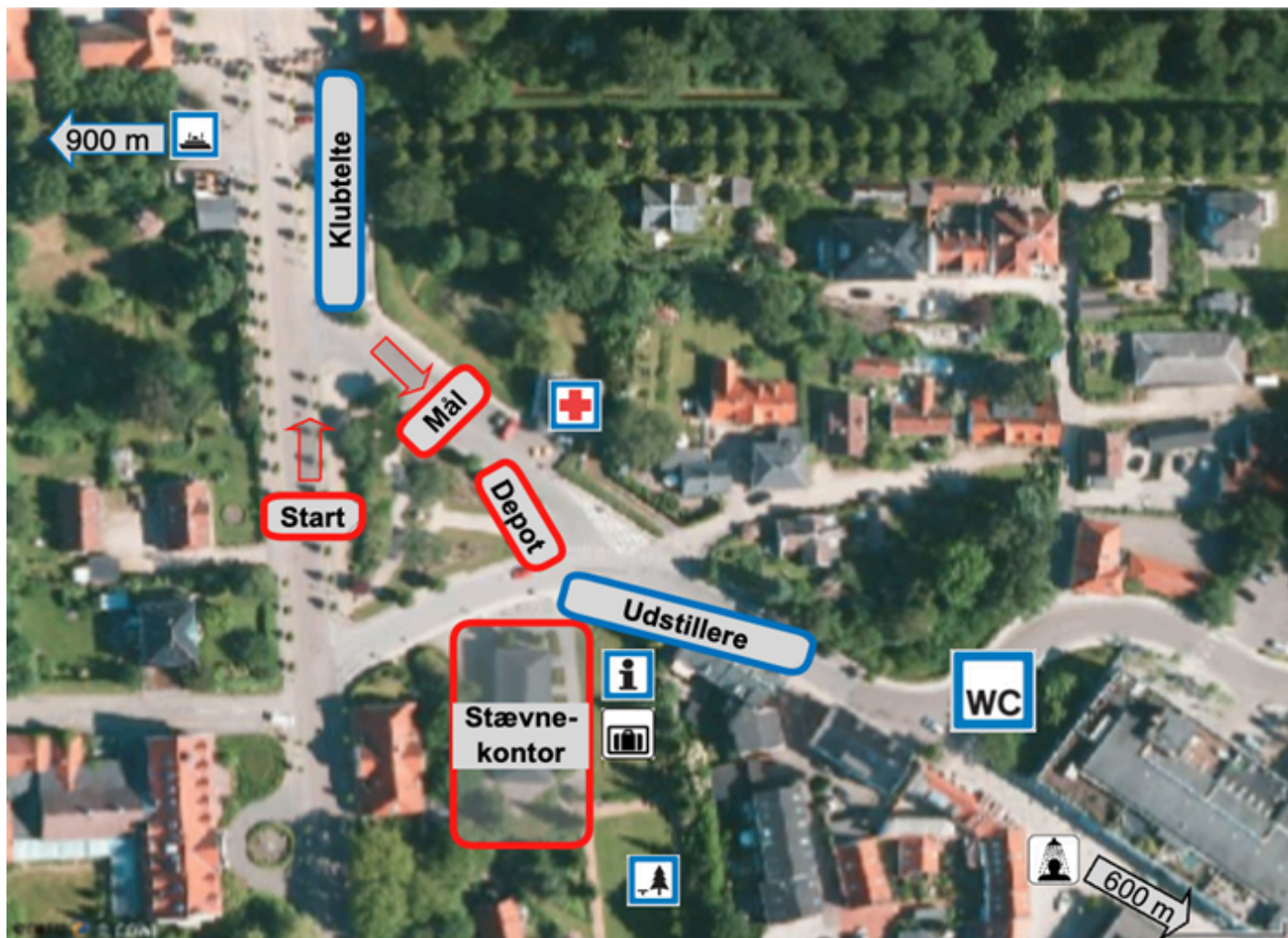
Stævneplads med start/mål, information og toiletforhold